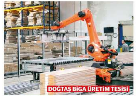
DOĞTAŞ BIGA ÜRETİM TESİSİ