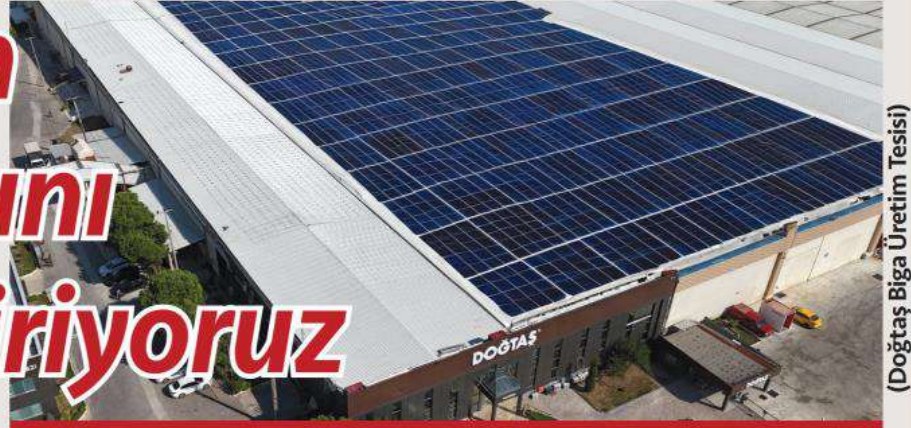
(Doğtaş Biga Üretim Tesisi)

DOĞANLAR Mobilya Grubu olarak sürdürülebilirliği, uzun vadeli değer yaratma sürecimizin ayrılmaz bir parçası olarak görüyoruz. Çevresel, sosyal ve yönetim (ÇSY) kriterlerini iş süreçlerimize entegre ederek sadece finansal başarıyı değil, aynı zamanda topluma ve gezegene olan sorumluluklarımızı da ön planda tutuyoruz.